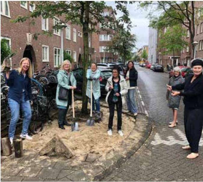
NK Tegelwippen 60 tegels uit de stoepuin