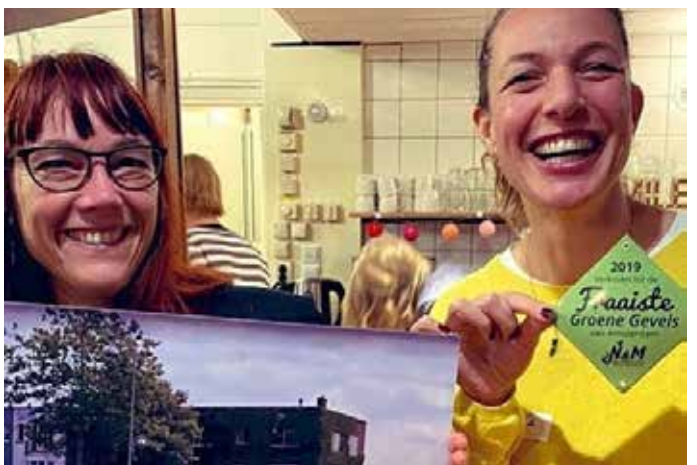
Hele blijе winnaressen van de Meeuwenlaan