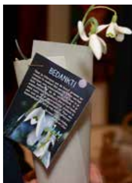
Sneuwklokje als presentje voor de vrijwilligers