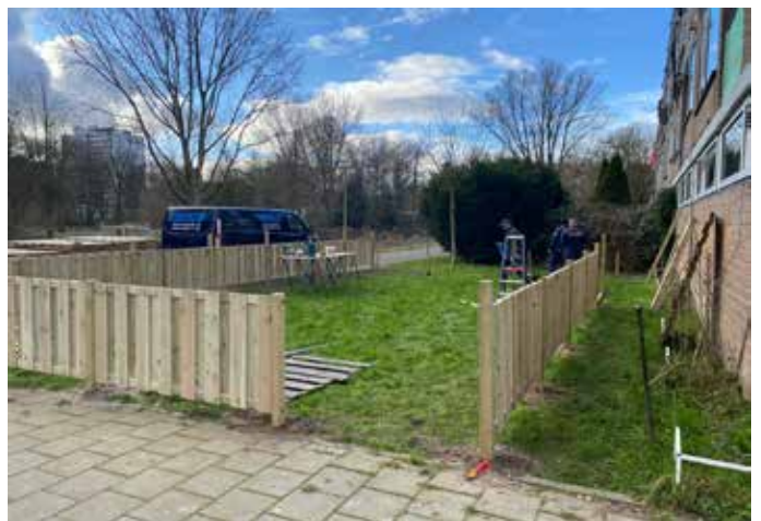
Moestuin Sypestein is omheind