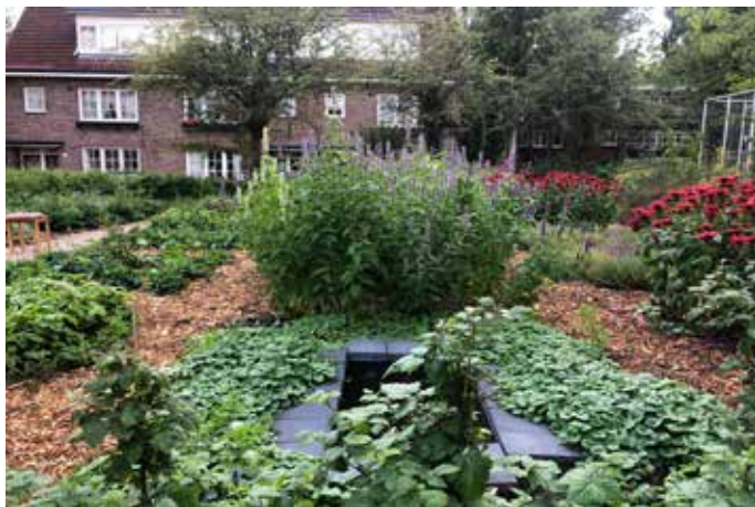
In July is de tuin al aardig groen geworden