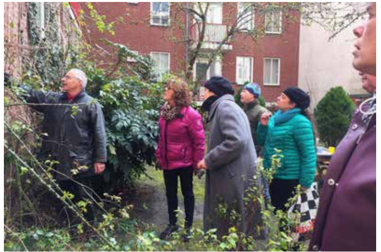
Hercules Seghers binnentuin snoeiles