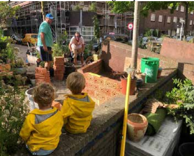
Meerhuizenplein metselenn verhoogde borders