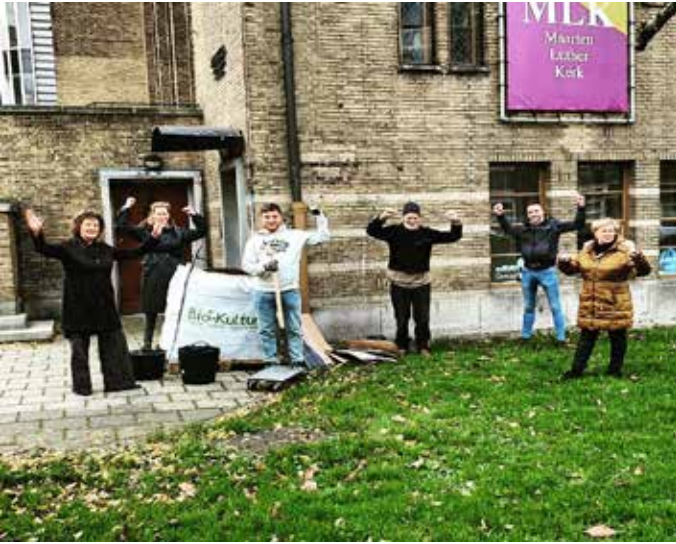
Planten ingeplant Lijterwaardenstraat