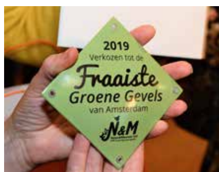
Emaillen gevelplaatje als onderscheiding