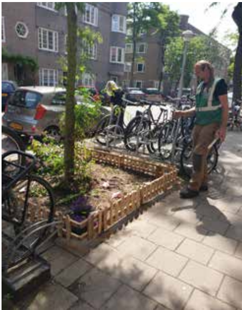
Stadshout plaatst de hekjes