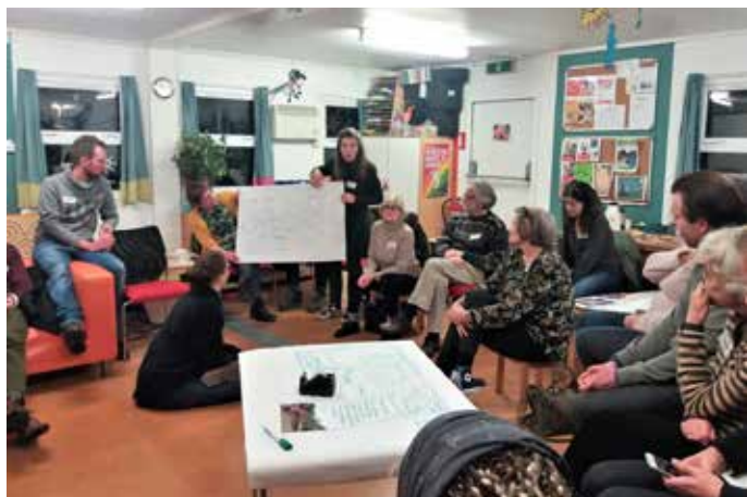
Bijeenkomst Goudestein speeltuin