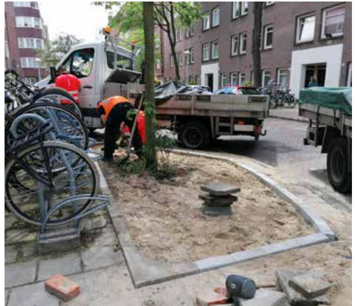
Stoere mannen van stadswerken bezig