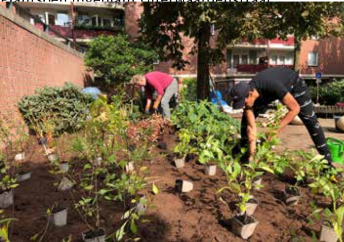
Inplanten border Hercules Seghersplein