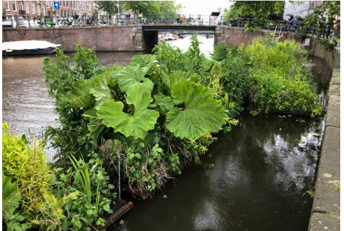
Na een roerig jaar keert de rust weer terug. Tijdens corona zijn er zelfs nog 38 tuinen vervangen door de vrijwilligersploeg