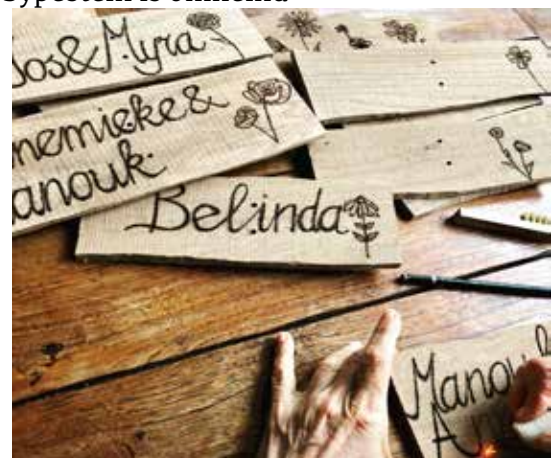
Zelfgemaakte bordjes voor de boomtuinen Vechtstraat