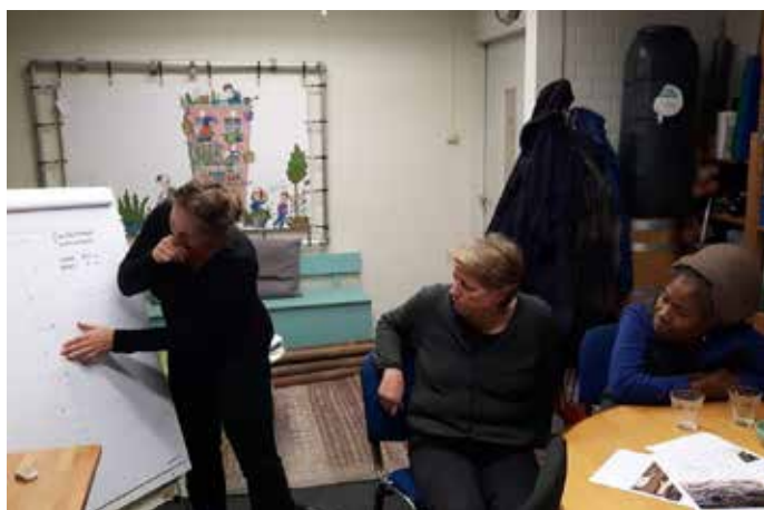
Pastelbuurtgroep ideeën en moodbord maken ->