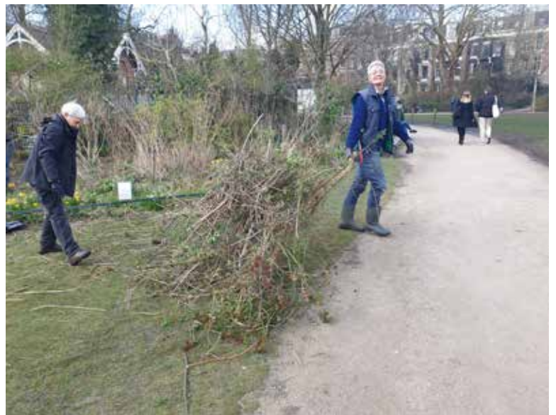
Sarphatipark snoeiles medebeheerploeg