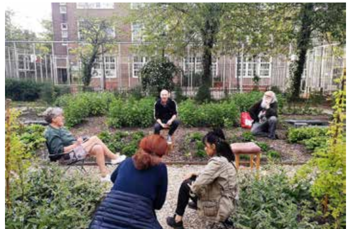
coronaproof klus overleg