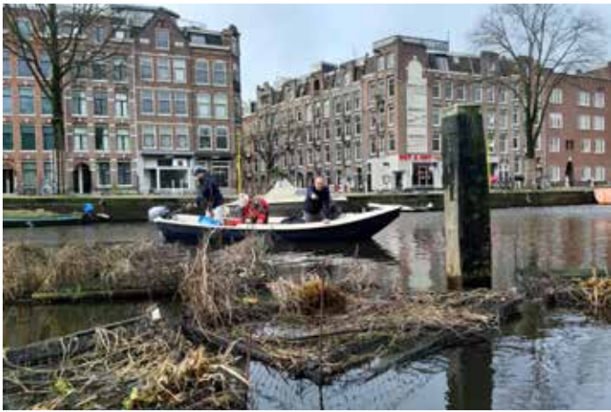
Losgeslagen watertuinen weer vastleggen