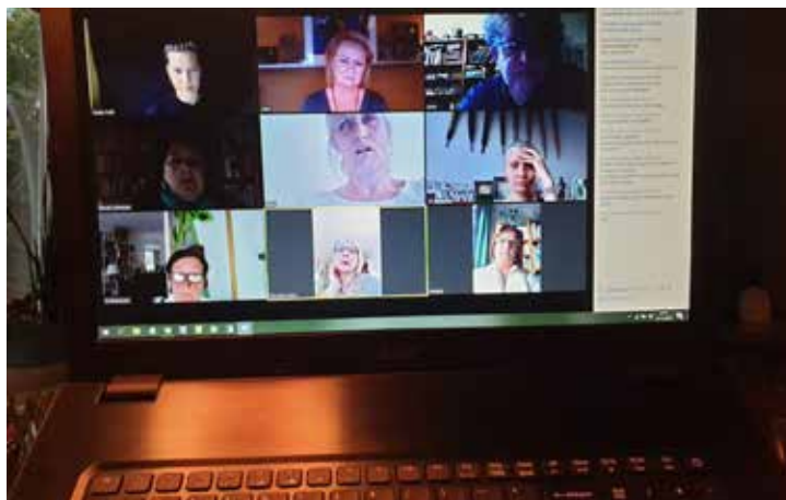
Brainstorm over geveltuinvergroening via zoom