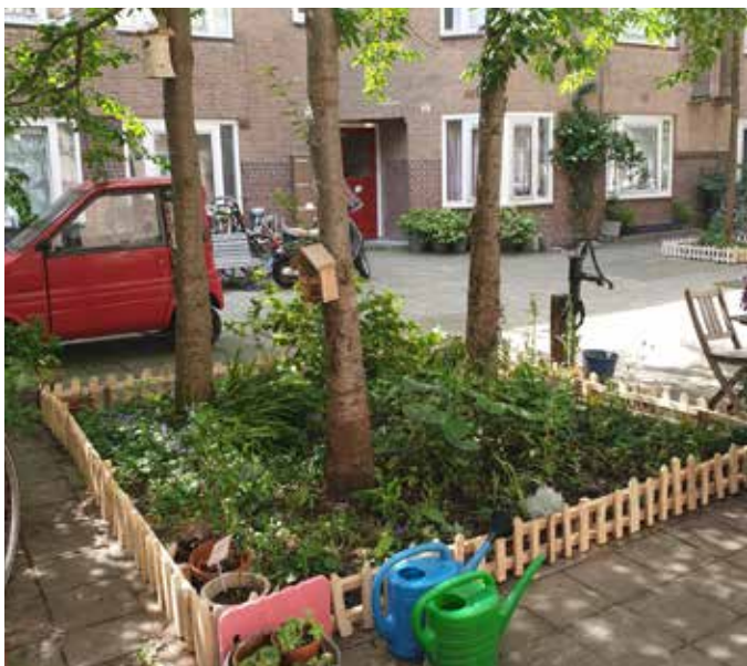
De grootste boomtuin met tuinpomp