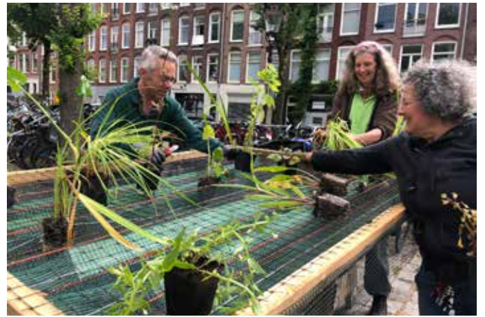
Inplanten van de nieuwe tuinen