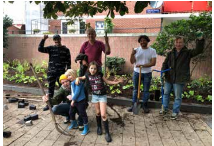
Enthousiaste tuingroep Hercules Seghersplein