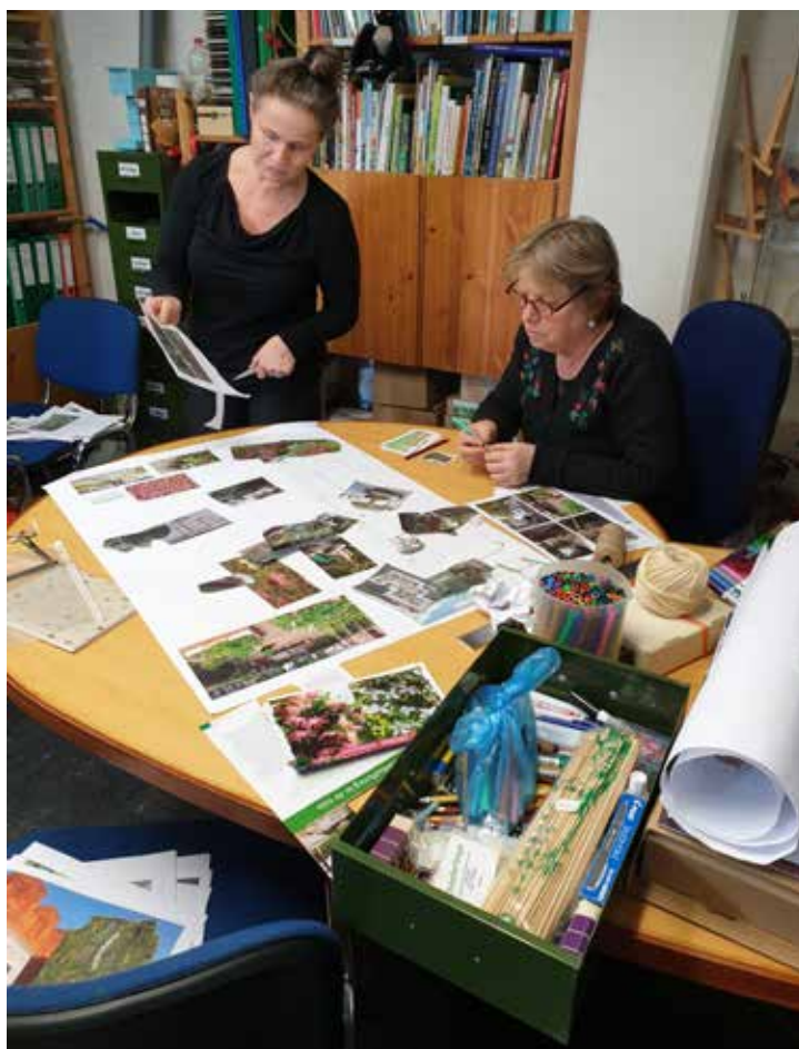
Repair Cafe voor Corona