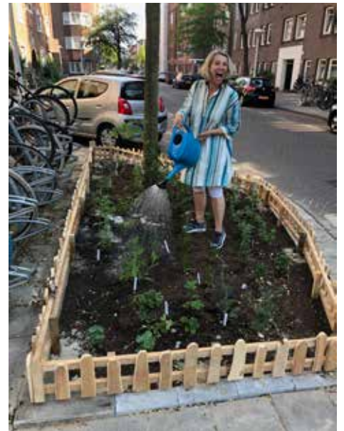
PlantZoentje is klaar!