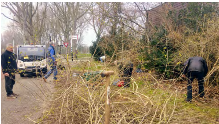
Snoeicursus op Twikkel