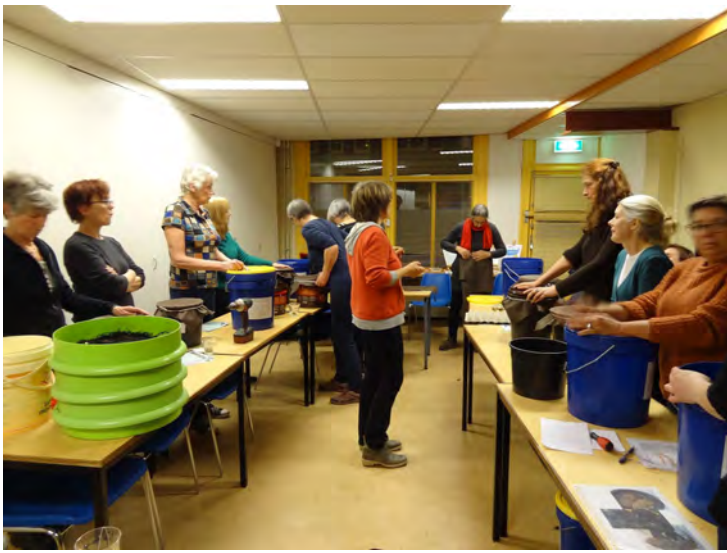
Maak je eigen compostbak