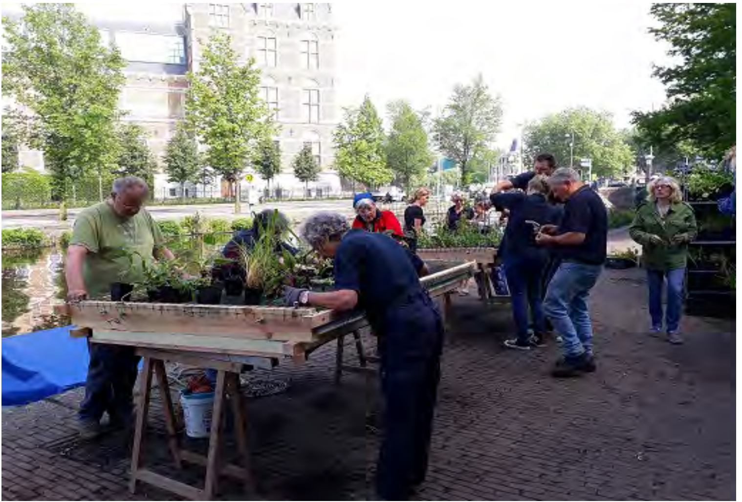
Inplantdag 55 watertuinen