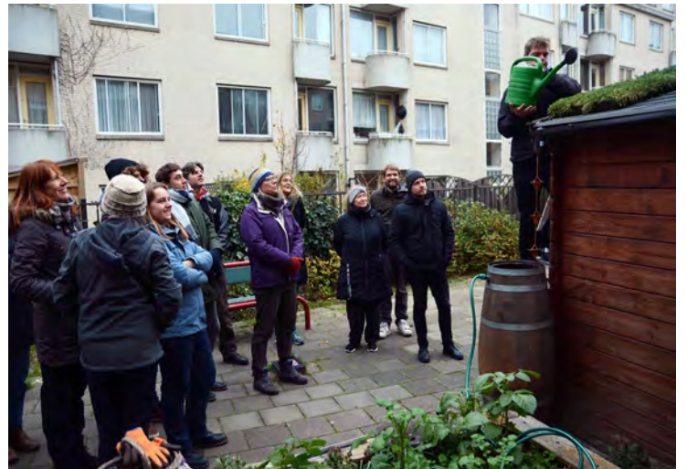
Uitreiken Fraaiste Groene Gevel certificaten