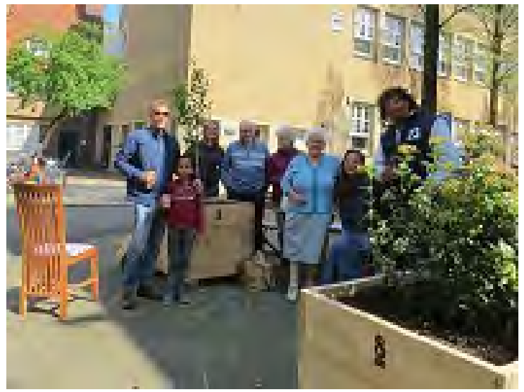
Bloembakken Jozef Israëlskade en Paletstraat