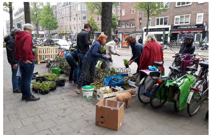
Boomtuinactie Van Woustraat