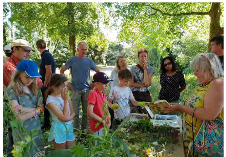
Planten leren determineren op Twikkel