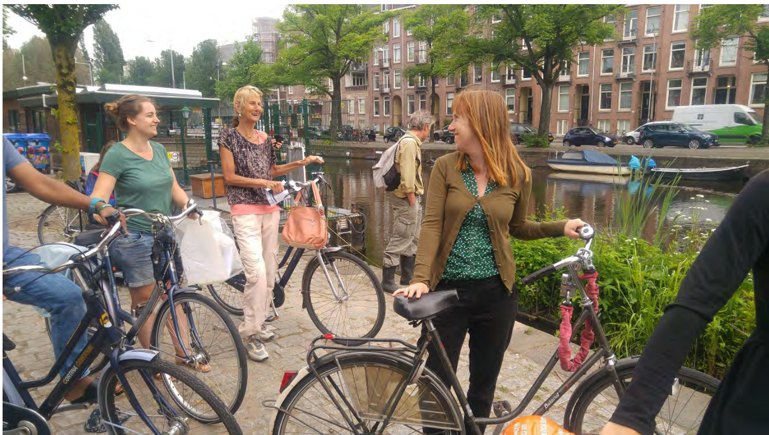
Groen Café on tour in De Pijp langs onze projecten