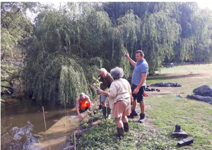
Oevers inplanten Sarphatipark